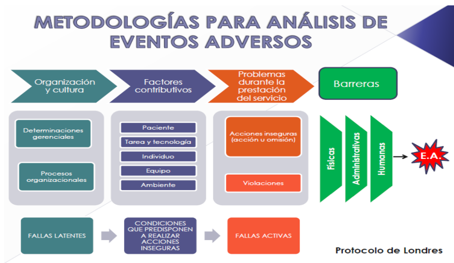
Figura 2. Protocolo de Londres

Cada Prestador de Servicios de Salud es autónomo en elegir la herramienta de análisis de los eventos e incidentes adversos para la evaluación de cada uno de los casos.